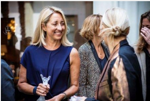
Achiever Awards 2015

LES ACHIEVER AWARDS DU CEW RECOMPENSENT DES FEMMES- ET A PARTIR DE 2017 DES HOMMES - DONT LA CRÉATIVITÉ, L'ÉNERGIE, LES VALEURS ET LES CONVICTIONS FONT AVANCER LA BEAUTÉ.